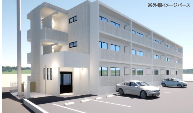
※外観イメージパース